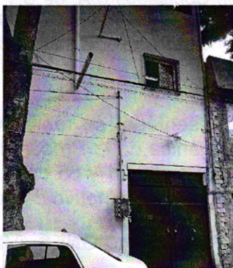
Fotografía 1. Vista del establecimiento mercantil con giro de elaboración de alimentos denominado "Grupo Mexicano de Calidad en Confitados S.A. de C.V".

Aunado a lo anterior, y con la finalidad de contar con mayores elementos, se citó a comparecer al representante legal del establecimiento mercantil en comento, quien en fecha veintidós de agosto de dos mil diecinueve, se presentó a comparecer en las oficinas de esta Procuraduría, manifestando que durante sus actividades utilizan dos equipos generadores de emisiones sonoras, una cortadora manual y una batidora, los cuales cuentan con mecanismos mitigadores de ruido.