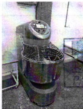
Fotografía 2. Batidora.