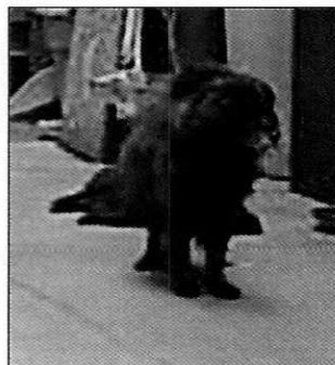
Figuras 1-2. Vista de los ejemplares caninos.

Medellín 202, piso 4, colonia Roma Sur Alcaldía Cuauhtémoc, C.P. 06000, Ciudad de México Tel. 5265 0780 ext 12011 Y 12400