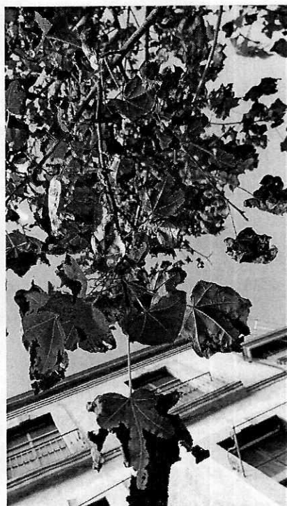
Fotografías 1 y 2. Vista del árbol motivo de denuncia y detalle de la afectación por el patógeno.