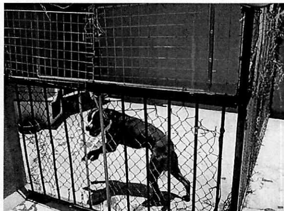
Fotografía 1-2. Vistas del ejemplar canino.

Finalmente, y considerando que no se detectaron signos de maltrato animal, se requirió al propietario del ejemplar objeto de la presente denuncia a seguir cumpliendo con las condiciones adecuadas de bienestar respecto al alimento, agua, higiene, movilidad, alojamiento y comportamiento.