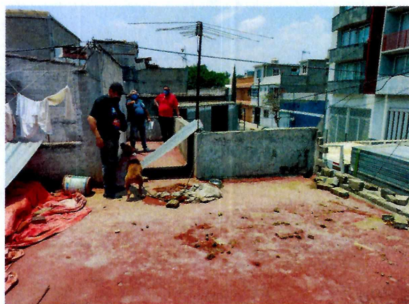
Imagen 1 y 2. Ejemplar canino y su lugar de alojamiento.