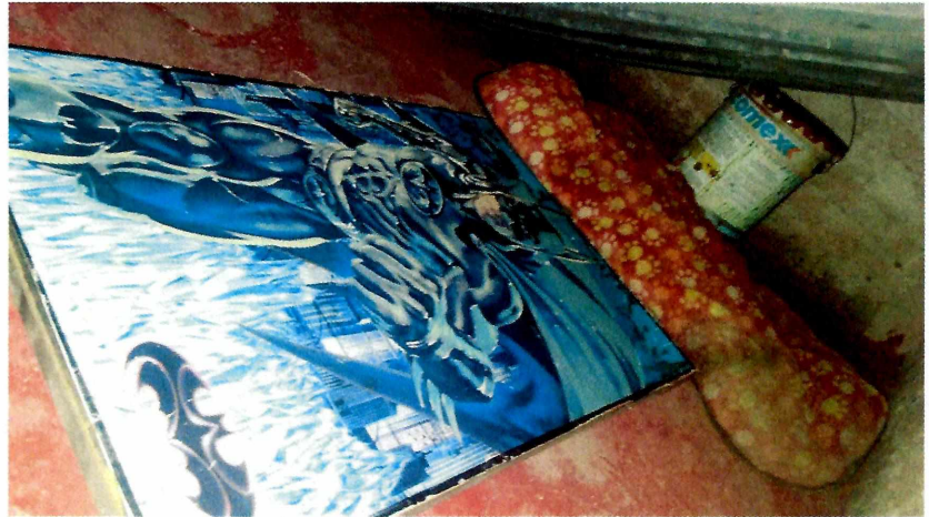
Fotografía 3 y 4. Recomendaciones realizadas

En virtud de lo antes expuesto, esta Entidad considera procedente emitir la presente resolución, de conformidad con el artículo 27 fracción VII de la Ley Orgánica de esta Procuraduría, por el cumplimiento voluntario de las disposiciones jurídicas en materia de bienestar animal.