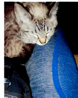
Fotografías 3-6. Recomendaciones realizadas por el propietario.

En virtud de lo antes expuesto, esta Entidad considera procedente emitir la presente resolución, de conformidad con el artículo 27 fracción VII de la Ley Orgánica de esta Procuraduría, por el cumplimiento voluntario de las disposiciones jurídicas en materia de bienestar animal.