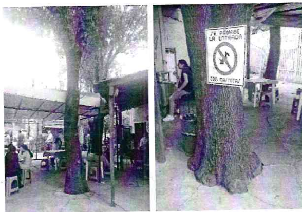
Imágenes 1-2.- Árboles afectados, objeto de investigación.

Al respecto, de las documentales que obran en el presente expediente, se desprende que personal adscrito a esta Procuraduría llevó a cabo el reconocimiento de hechos establecido en el artículo 15 BIS 4 fracción IV de la Ley Orgánica de esta Entidad, diligencia en la que se constató la presencia de dos individuos arbóreos de la especie Fraxinus sp , comúnmente conocidos como fresnos, de una altura de 13 metros y un diámetro a la altura del pecho de 45 y 60 centímetros respectivamente, los cuales presentaban cemento en la base de su tronco principal.