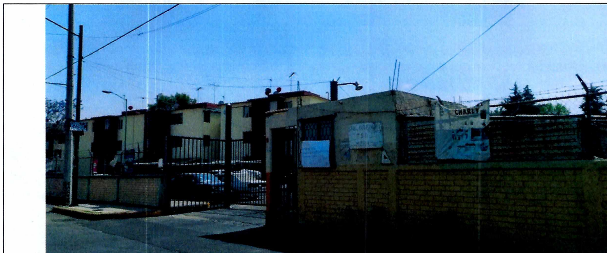
Fotografía 1. Lugar motivo de denuncia.

En este sentido, de las constancias que obran en el presente expediente, se desprende que personal de esta Subprocuraduría llevó a cabo una visita de reconocimiento de hechos, de acuerdo a lo establecido en el artículo 15 BIS 4 fracción IV de la Ley Orgánica de esta Entidad, diligencia durante la cual personal de esta entidad se entrevistó con vigilancia del lugar el cual refirió no poder permitir el acceso sin previa autorización, acto seguido, se procedió a marcar a la persona denunciante, la cual refirió que ya no era necesaria nuestra presencia toda vez que el canino fue dado en adopción en días anteriores por lo que los hechos dejaron de existir. .