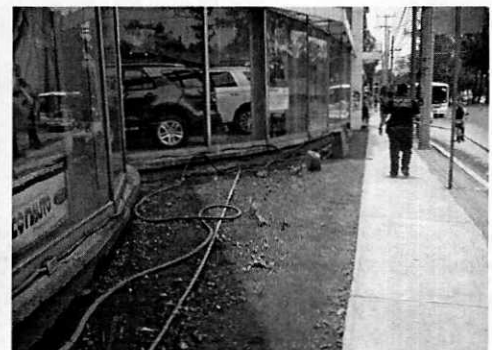
Figuras 1-3. Vista de la parte frontal de la agencia donde fueron retirados los arbustos.