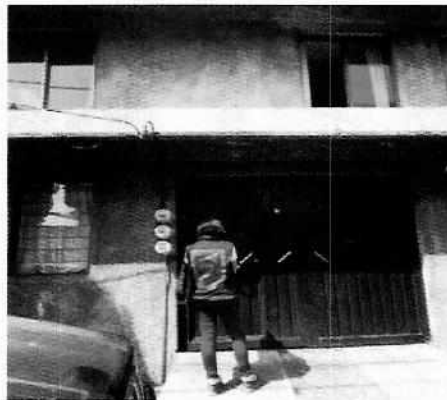
Imagen 1. Fachada del domicilio referido en la denuncia

En este sentido, de las constancias que obran en el presente expediente, se desprende que personal de esta Subprocuraduría llevó a cabo una visita de reconocimiento de hechos, de acuerdo a lo establecido en el artículo 15 BIS 4 fracción IV de la Ley Orgánica de esta Entidad, diligencia durante la cual una persona habitante del lugar donde se denunciaron los hechos objeto de la presente investigación, hizo de conocimiento al personal adscrito a esta Subprocuraduría que el ejemplar canino que fue señalado en el escrito de la denuncia, ya no se encuentran en el inmueble, lo anterior toda vez que una asociación protectora de animales se llevó en reguardo al ejemplar canino. Cabe señalar que el personal de la PAOT constató que efectivamente no había algún ejemplar con las características descritas en la denuncia al interior del domicilio en cuestión.