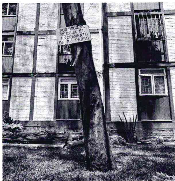
Se muestra el letrero clavado al tronco del árbol

Al respecto, de las documentales que obran en el presente expediente, se desprende que personal adscrito a esta Procuraduría llevó a cabo el reconocimiento de hechos establecido en el artículo 15 BIS 4 fracción IV de la Ley Orgánica de esta Entidad, diligencia en la que se constató la presencia de un individuo arbóreo de la especie Eucalyptus globulus , comúnmente conocido como eucalipto, de una altura de 9 metros y un diámetro del tronco a la altura del pecho de 60 centímetros, ubicado en una jardinera de 15 metros de altura, el cual presenta un letrero clavado en su tronco, mismo que fue retirado en el acto con ayuda de habitantes del sitio, con lo que se solucionó la problemática existente.