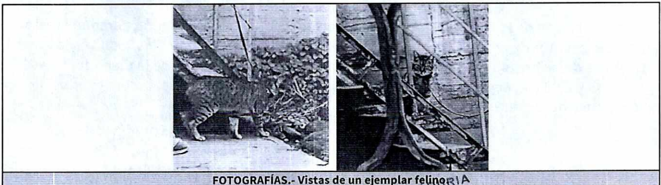
FOTOGRAFÍAS.- Vistas de un ejemplar felino