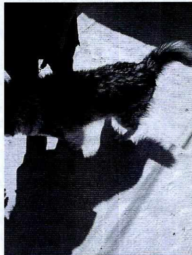
Fotografía 1 y 2. Vista del ejemplar con condición corporal ideal.