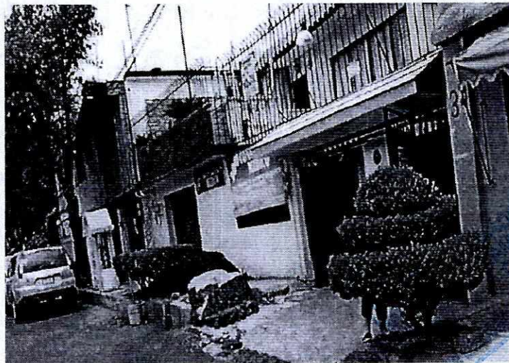
Fotografía 1. Vista del tocón.

En este sentido, de las constancias que obran en el expediente en el que se actúa, se desprende que personal adscrito a esta Subprocuraduría, realizó el reconocimiento de hechos correspondiente constituyéndose en calle Azalea, frente al inmueble marcado con el número 34, de la colonia Xaltocan, Alcaldía Xochimilco, observando que en la acera de dicho inmueble se localiza el tocón de un sujeto arbóreo de 97 cm de diámetro; sin que éste presentara signos o evidencia de pudrición o presencia de organismos patógenos.