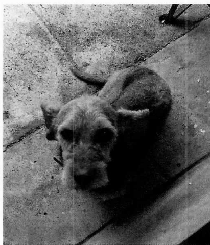
Fotografías 1 y 2. Se muestra ejemplar canino antes descrito.

Medellín 202, piso 4, colonia Roma Norte Alcaldía Cuauhtémoc, C.P. 06000, Ciudad de México Tel. 5265 0780 ext. 12011 y 12400