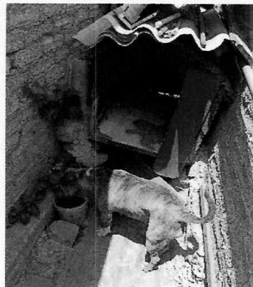
Fotografías 1 y 2. Se muestra ejemplar canino antes descrito.

Medellín 202, piso 4, colonia Roma Norte Alcaldía Cuauhtémoc, C.P. 06000, Ciudad de México Tel. 5265 0780 ext. 12011 y 12400