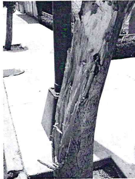
Fotografías 1 y 2. Vista del árbol motivo de denuncia y detalle del impacto mecánico del que fue objeto.

Al respecto, del dictamen técnico elaborado por el personal de esta Entidad, se desprende que, al haberse puesto en riesgo la sobrevivencia del sujeto arbóreo, se encuentra en el supuesto considerado en el artículo 119 de la Ley Ambiental de Protección a la Tierra en el Distrito Federal; por lo cual, se procedió a valorar la restitución física correspondiente, de conformidad con el numeral 9 de la Norma Ambiental NADF-001-RNAT-2015, de cuyo Anexo 3 y con base en los datos obtenidos en el sitio, se desprende que la restitución física corresponde a la entrega de dos árboles de 4 m de altura.