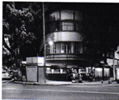
Se muestra el establecimiento denunciado

En ese sentido, personal de esta Subprocuraduría llevó a cabo estudio técnico de las emisiones sonoras producidas por el establecimiento denunciado, mediante el cual se acreditó que el establecimiento denunciado generaba un nivel sonoro desde el punto de denuncia de 65.42 dB(A) valores que excedían los límites máximos permisibles especificados en la Norma Ambiental para el Distrito Federal NADF-005-AMBT-2013.