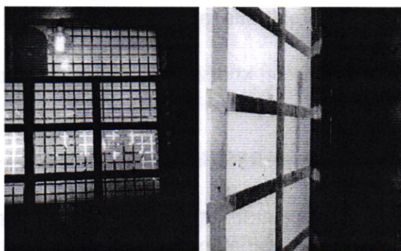
Se muestran las ventanas acústicas colocadas en el establecimiento.

Al respecto, mediante oficio se hizo del conocimiento al responsable del establecimiento denunciado el resultado del estudio antes mencionado, quien a efecto de cumplir de manera voluntaria con las disposiciones jurídicas en materia ambiental aplicables, informó mediante escrito que llevó a cabo las medidas de mitigación consistentes en la instalación de ventanas acústicas, el cierre de puertas, ventanas y dos cortinas metálicas a partir de las 20:00 horas, lo anterior con la finalidad de disminuir sus emisiones sonoras.