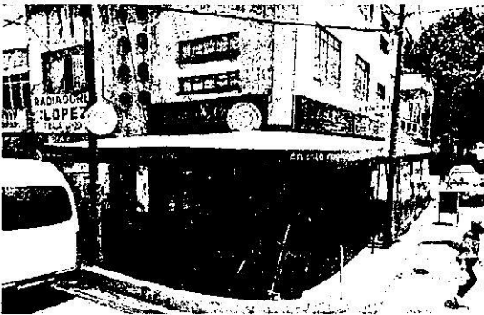
Agosto 2022