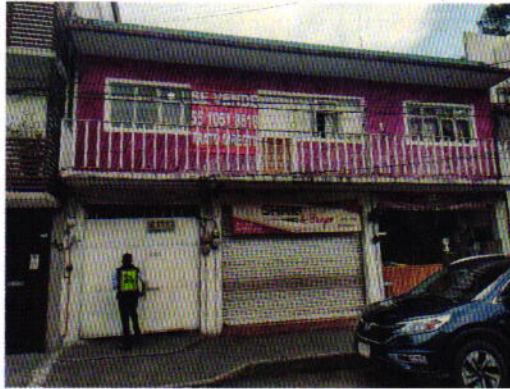
Figura 1. Sitio motivo de denuncia.

En este sentido, de las constancias que obran en el presente expediente, se desprende que personal de esta Subprocuraduría llevó a cabo una visita de reconocimiento de hechos, de acuerdo a lo establecido en el artículo 15 BIS 4 fracción IV de la Ley Orgánica de esta Entidad, diligencia durante la cual desde el espacio público no se constató la existencia de algún ejemplar canino, ladridos provenientes del interior del inmueble de referencia u olores característicos de su presencia, de igual manera se observó que la dirección correcta del sitio referido en el escrito de denuncia es: calle Club Necaxa, número 42, colonia Villa Lázaro, Alcaldía Tlalpan.