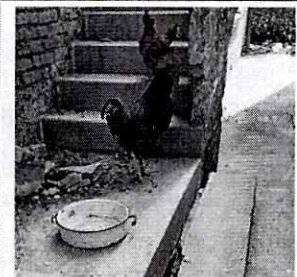
FOTOGRAFÍAS.- Vistas de los animales.

No obstante lo anterior, mediante el oficio correspondiente, se informó a la persona responsable de los ejemplares caninos objeto de investigación, las obligaciones que prevé la Ley de Protección a los Animales de la Ciudad de México al contar con animales de compañía, conminándolo a su debido cumplimiento.