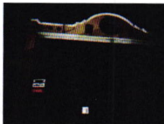
Figura 1. Vista del establecimiento mercantil motivo de denuncia.

En seguimiento de lo anterior, se llevó a cabo una visita de reconocimiento de hechos, de acuerdo a lo establecido en el artículo 15 BIS 4 fracción IV de la Ley Orgánica de esta Entidad, diligencia durante la cual desde el espacio público se observó que el establecimiento mercantil motivo de denuncia no se encontraba en funcionamiento, motivo por el cual no se constató generación de emisiones sonoras que fueran susceptibles de medición acústica.