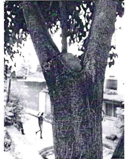
Fotografías 1, 2 y 3. Vista de los árboles intervenidos y detalles de las podas realizadas.

Cabe señalar que, mediante consulta realizada por personal de esta Entidad en la herramienta "Google Maps", a través de imagen fechada en noviembre de 2014, se tuvo conocimiento de que en el sitio se erguía el mismo número de árboles que fueron constatados por el personal de esta Procuraduría durante la visita de reconocimiento de hechos correspondiente.