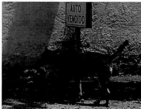
Se muestra a los ejemplares caninos motivo de denuncia.

No obstante, mediante oficio se hizo del conocimiento de la persona responsable de los ejemplares caninos objeto de investigación, las responsabilidades que se tienen que cumplir al tener animales de compañía, conminándolo a su debido cumplimiento.