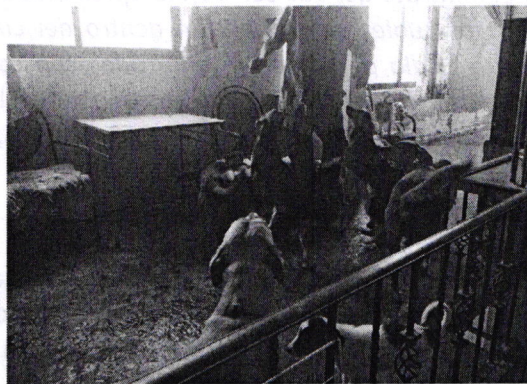
Fotografía 1 y 2. Ejemplares caninos motivo de denuncia.