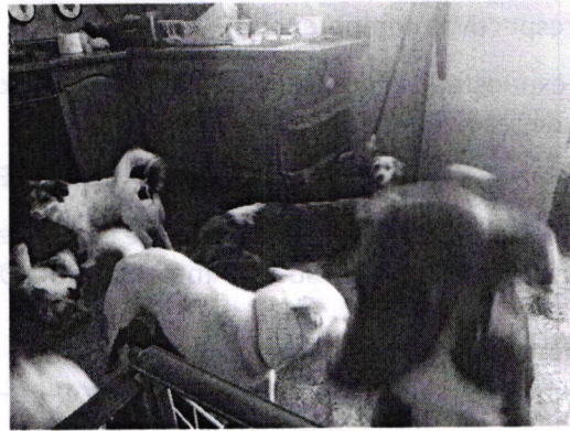
Fotografía 3 y 4. Lugar de alojamiento limpio.

En seguimiento a la denuncia, se solicitó a la persona denunciante mayor información sobre los actos de maltrato y/o crueldad animal que motivaron su denuncia, para lo cual se le concedió un plazo de 5 días hábiles; sin embargo, transcurrido el plazo otorgado, no aportó elementos o información adicional.