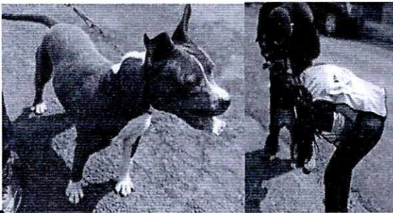
Imagen 1. Ejemplar canino hembra llamada "Chata".