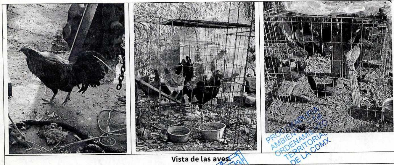
Vista de las aves

Con base en lo antes citado, esta Entidad considera que una vez que se dio atención a la presente denuncia por parte del personal adscrito a esta Subprocuraduría, se está en aptitud de emitir la resolución administrativa que conforme a derecho proceda, esto de acuerdo con la fracción VI del artículo 27 de la Ley Orgánica de la Procuraduría Ambiental y del Ordenamiento Territorial de la Ciudad de México, por imposibilidad legal, en virtud de que no se constataron irregularidades en materia de bienestar animal.