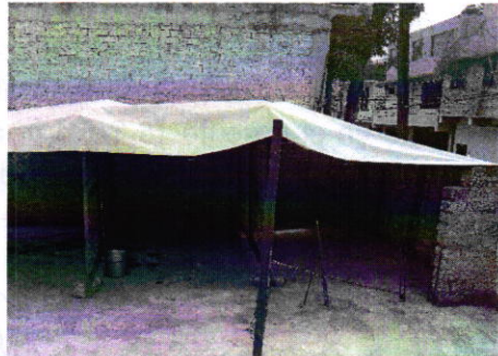
Fotografía 3. Vista del sitio de alojamiento de los ejemplares caninos motivo de denuncia.

No. de Folio: PAOT-05-300/200- 11291 -2019