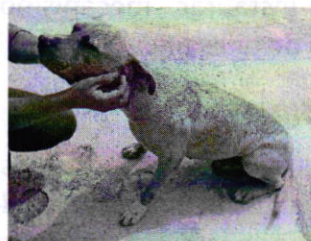
Fotografía 2. Vista del ejemplar canino que responde al nombre de “Santo”.