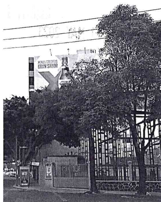
Fuente PAOT: Reconocimiento de hechos de fecha 02 de agosto de 2022.

Al respecto, el artículo 74 de la Ley de Desarrollo Urbano de la Ciudad de México, dispone que la fijación, modificación y eliminación de publicidad exterior y anuncios visibles desde la vía pública, requieren de licencia o autorización temporal de la autoridad competente, o bien de la presentación de aviso, según corresponda, de conformidad con las disposiciones aplicables, las cuales determinarán los requisitos y procedimientos para su otorgamiento y los supuestos de revocabilidad. -----