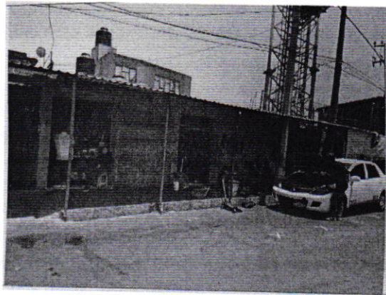
Se muestra el taller motivo de la denuncia

En seguimiento a lo anterior, personal de esta Subprocuraduría llevó a cabo una visita de reconocimiento de hechos, diligencia en la que no se constató la generación de emisiones sonoras provenientes de las actividades del taller denunciado