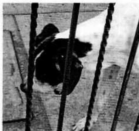
Fotografías 1-4. Vista de los cuatro ejemplares caninos, mismos que se encontraban libres en el patio del predio; se observa la lesión que presenta el gran danés en la parte posterior de sus orejas.