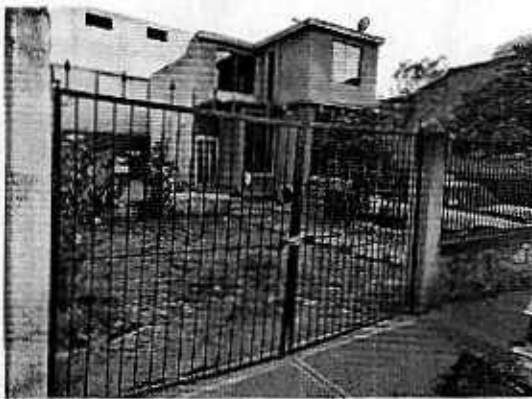
Fotografía 6. Vista del predio motivo de denuncia, donde no se constató la presencia de algún ejemplar canino.

En fecha catorce de enero de dos mil veinte, personal adscrito a esta Entidad llevó a cabo una visita de reconocimiento de hechos, durante la cual no se constató la presencia de algún ejemplar canino en el predio motivo de denuncia; motivo por el cual se realizó llamada telefónica al número proporcionado por el propietario de los caninos, sin embargo no se tuvo respuesta. Al respecto se le hizo del conocimiento a la persona denunciante que cuatro de los ejemplares caninos habían sido dados en adopción y actualmente no se constató la presencia de ningún canino en el lugar, hechos que fueron corroborados por dicha persona, quien manifestó que los caninos ya no se encuentran en dicho predio por lo que los hechos que motivaron su denuncia dejaron de presentarse.