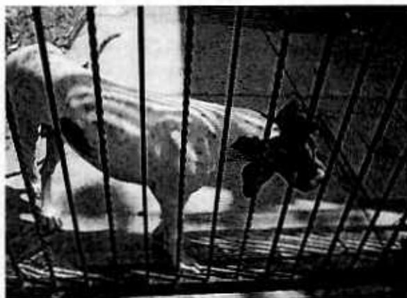
Fotografía 5. Vista del gran danés, con una mejoría en las heridas que presentaba detrás de sus orejas.

Durante una nueva visita de reconocimiento de hechos, personal de esta Subprocuraduría únicamente constató la presencia del canino de la raza gran danés, el cual presentaba una mejoría en las heridas que presentaba en las orejas; por lo anterior, se tuvo comunicación con el propietario de los caninos, quien manifestó que los otros tres ejemplares caninos ya habían sido dados en adopción.