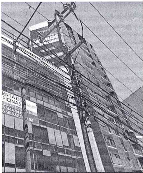
Imagen de fecha de marzo de 2022