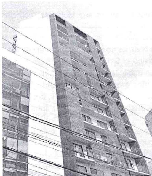
Imagen de fecha de noviembre de 2021

En seguimiento, personal adscrito a esta Entidad realizó una nueva visita de reconocimientos de hechos en fecha 12 de abril de 2023, sin constatar publicidad instalada en el inmueble de mérito. -----