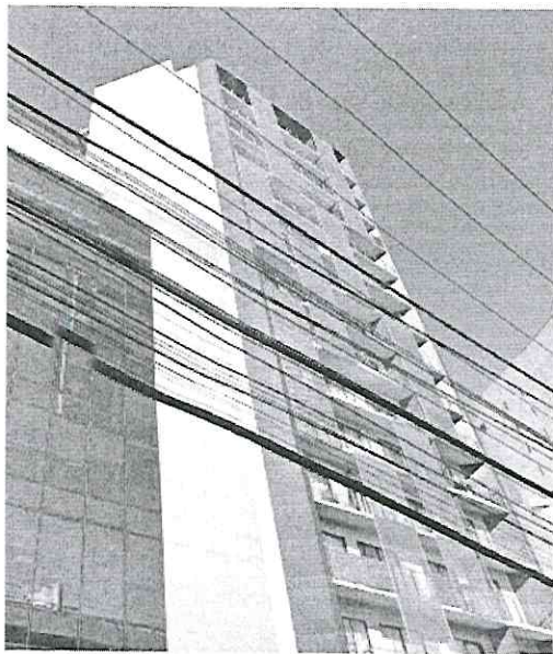
Imagen de fecha de noviembre de 2022

Por otra parte, personal adscrito a esta Entidad realizó análisis multitemporal, de las imágenes obtenidas en Google Maps utilizando la herramienta Street View, en las que se observó que de julio a noviembre de 2021, no existe publicidad instalada. Posteriormente, entre marzo y julio de 2022, se observa un anuncio adosado al muro ciego poniente, con publicidad de distintas marcas, entre otras, "Huggies" e "Impex"; sin embargo, en noviembre de 2022, no se observa publicidad. -----