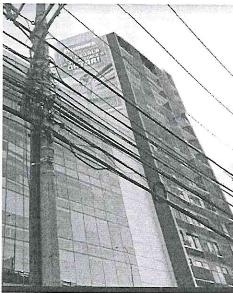
Imagen de fecha de julio de 2022