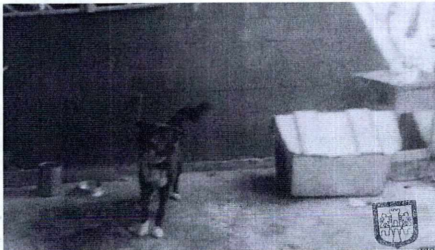
Vista del canino.

PROCURADURIA AMBIENTAL Y DEL ORDENAMIENTO TERRITORIAL DE LA CDMX