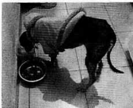
Figuras 1-2. Se observa al ejemplar canino motivo de denuncia, mismo que se encuentra libre dentro del departamento, donde cuenta con agua, alimento y refugio.