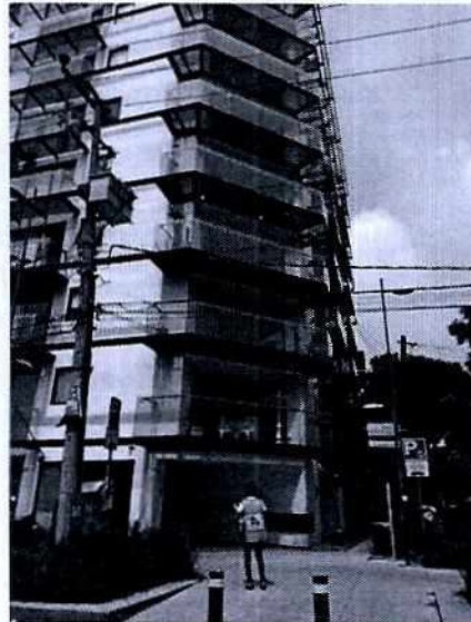
Imágenes 1 y 2. Inmueble indicado en la denuncia y balcones del edificio en donde no se observa algún ejemplar.

En seguimiento de lo anterior, personal de esta Subprocuraduría trató de entablar comunicación vía telefónica con la persona denunciante; sin embargo, en el número proporcionado en el escrito de denuncia se indicó desconocer a la persona denunciante, asimismo, se intentó comunicación vía correo electrónico, sin contar con respuesta correspondiente.