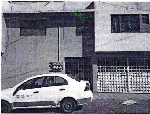
Imagen 1. Foto del domicilio visto desde la vía pública

En este sentido, personal de esta Subprocuraduría realizó una visita de reconocimiento de hechos de acuerdo a lo establecido en el artículo 15 BIS 4 fracción IV de la Ley Orgánica de esta Entidad, diligencia en la que personal actuante en la cual no se encontró a algún habitante del inmueble objeto de investigación, por lo cual se dejó un oficio citatorio para que se presentara a las oficinas de esta Procuraduría a comparecencia. Asimismo, no se percibieron olores característicos a orines, heces o a la presencia de ejemplares caninos.