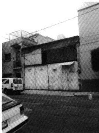
Se muestra la fábrica motivo de la denuncia.

En seguimiento a lo anterior, personal de esta Subprocuraduría llevó a cabo una visita de reconocimiento de hechos en el horario solicitado por la persona denunciante, diligencia en la que no se constató la generación de emisiones sonoras o a la atmósfera provenientes de las actividades de la fábrica denunciada, por lo que no se cuenta con elementos para determinar irregularidades en materia ambiental.