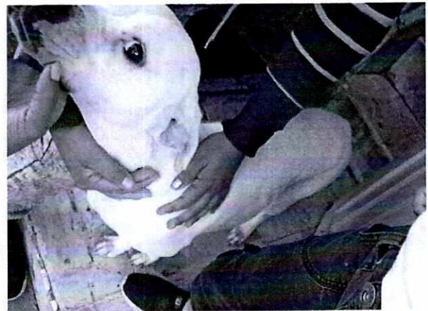
Fotografía 1. Vista del ejemplar canino en la azotea del inmueble. Fotografía 2. Muestra al ejemplar canino con condición corporal delgada.