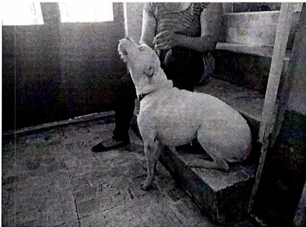
Fotografía 3. Muestra el ejemplar canino con condición corporal ideal.