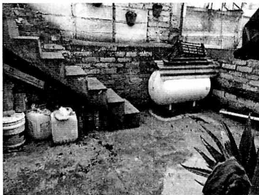
Imagen 1. Interior del domicilio motivo de denuncia.

En este sentido, de las constancias que obran en el presente expediente, se desprende que personal de esta Subprocuraduría llevó a cabo una visita de reconocimiento de hechos, de acuerdo a lo establecido en el artículo 15 BIS 4 fracción IV de la Ley Orgánica de esta Entidad, diligencia durante la cual una persona habitante del lugar donde se denunciaron los hechos objeto de la presente investigación, hizo de conocimiento al personal adscrito a esta Subprocuraduría que no se cuenta con ejemplares caninos al interior del domicilio; aunado a lo anterior, se permitió el acceso al personal de esta Subprocuraduría, realizando recorrido durante el cual no fueron constatados elementos que indicaran la presencia de ejemplares caninos, ni ladridos u olores característicos.