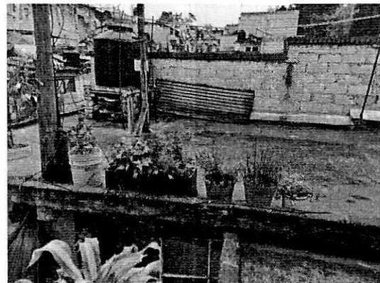
Imagen 2. Azotea del domicilio motivo de denuncia.

Es de resaltar que, en el Acuerdo de Admisión, que fue enviado por correo electrónico a la persona denunciante, se le hizo de conocimiento que contaba con un término de seis días hábiles para aportar las pruebas que estimara pertinentes en la investigación de los hechos, lo anterior conforme al artículo 90 del Reglamento de la Ley Orgánica de la Procuraduría Ambiental y del Ordenamiento Territorial de la Ciudad de México; sin embargo durante el procedimiento de investigación, no fueron proporcionados elementos de prueba que pudieran determinar incumplimiento a la normatividad en materia de bienestar animal.