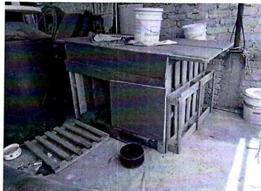
Fotografía 2. Muestra el lugar de alojamiento limpio.