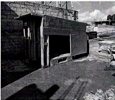
Fotografía 3. Muestra el espacio limpio.