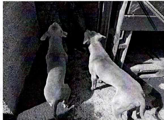
Fotografía 4. Muestra a los ejemplares caninos

Derivado de lo anterior, y no quedando actuaciones pendientes por parte de esta Subprocuraduría Ambiental, de Protección y Bienestar a los Animales para el caso que nos ocupa, se procede a dar por concluida la investigación de la denuncia ciudadana bajo el número de expediente citado al rubro, con fundamento en el artículo 27 fracción VII de la Ley Orgánica de la Procuraduría Ambiental y del Ordenamiento Territorial de la Ciudad de México.