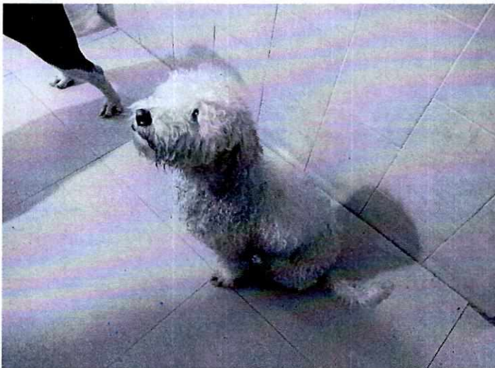
Fotografía 1. Vista del el ejemplar canino que responden al nombre de "Hachi".

En este sentido, de las constancias que obran en el presente expediente, se desprende que personal de esta Subprocuraduría llevó a cabo una visita de reconocimiento de hechos, de acuerdo a lo establecido en el artículo 15 BIS 4 fracción IV de la Ley Orgánica de esta Entidad, diligencias en la cual se constató la presencia de dos ejemplares caninos que cuentan con las características que se enlistan a continuación: