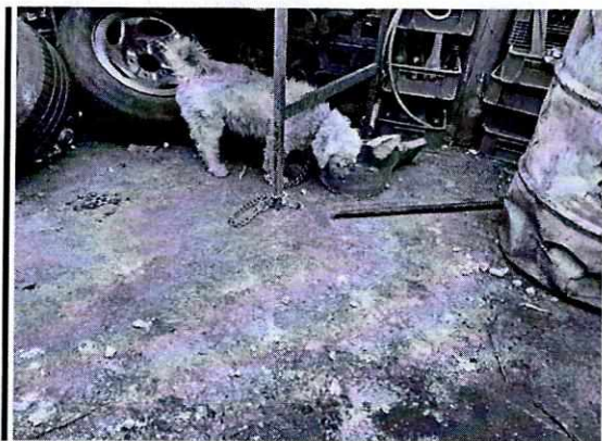
Fotografía 1. Vista del ejemplar canino.