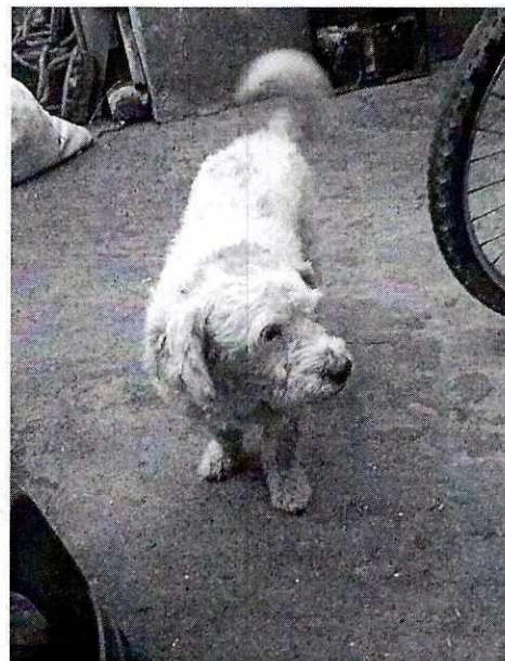
Fotografía 4. Muestra al ejemplar en su nuevo hogar en donde se encuentra de manera libre

Derivado de lo anterior, y no quedando actuaciones pendientes por parte de esta Subprocuraduría Ambiental, de Protección y Bienestar a los Animales para el caso que nos ocupa, se procede a dar por concluida la investigación de la denuncia ciudadana bajo el número de expediente citado al rubro, con fundamento en el