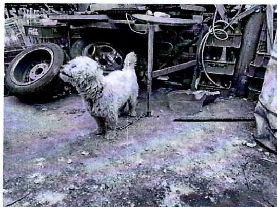
Fotografía 2. Muestra el lugar de alojamiento limpio.