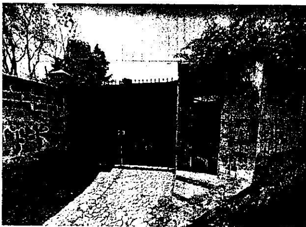
En julio de 2021, no se identificó cuerpo constructivo alguno

Aunado a lo anterior, personal adscrito a esta Subprocuraduría, realizó análisis comparativo multitemporal con imágenes obtenidas por medio de la página electrónica Google Maps, utilizando la herramienta Street View y fotografías del inmueble objeto de denuncia obtenidas en la visita de reconocimiento de hechos, de las cuales se desprende que entre julio de 2021 y marzo de 2022 se realizó una construcción de 2 niveles de altura en obra negra y para mayo de 2022, la construcción ya cuenta con aplanado de los muros exteriores. -