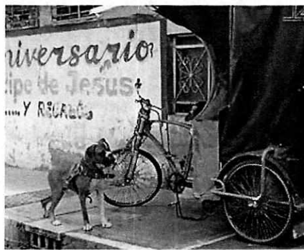
Fotografía 1-2. Vista del ejemplar canino y del domicilio señalado en la denuncia.

En seguimiento de lo anterior, personal de esta Entidad llevó a cabo una nueva visita de reconocimiento de hechos, durante la cual no se constató la presencia del ejemplar canino motivo de denuncia desde la vía pública, por lo cual se procedió a localizar a los propietarios