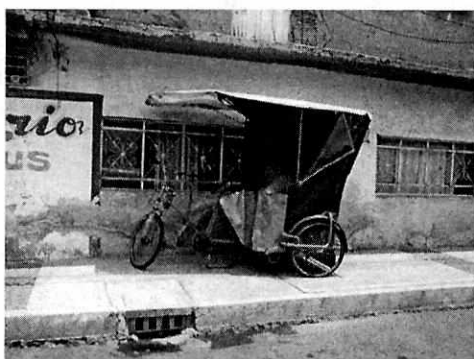
Fotografía 3. Se muestra el sitio donde se encontraba el animal de compañía.

del mismo, por lo que fuimos atendidos por el nuevo habitante del dicho domicilio, quien informó al personal actuante que los antiguos habitantes de ese departamento, se cambiaron de domicilio llevándose al perro consigo.