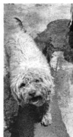
Imágenes 1-2.- Caninos objeto de investigación, (izquierda) "Daysi" y (derecha) "Yogui".