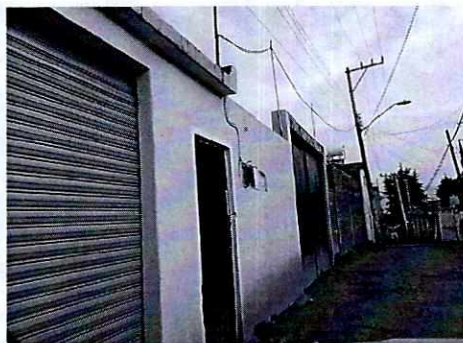
Se muestra el inmueble señalado en el escrito de denuncia.

En este sentido, personal de esta Subprocuraduría realizó dos reconocimientos de hechos de acuerdo a lo establecido en el artículo 15 BIS 4 fracción IV de la Ley Orgánica de esta Entidad, en donde se constató la existencia de un inmueble de dos niveles de altura, de fachada color rosa y puerta de acceso color negro; sin que se encontrara en el momento de la visita alguna persona que atendiera la diligencia, sin embargo se percibieron ladridos al interior del inmueble.