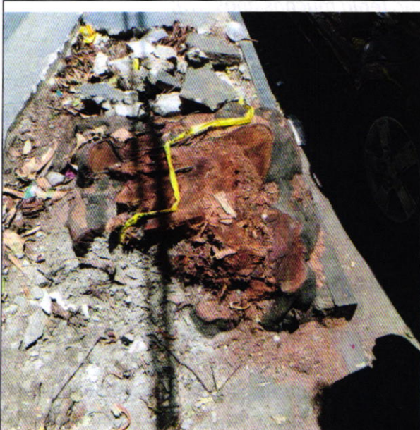
Fotografía 1. Vista del tocón.

En este sentido, de las constancias que obran en el expediente en el que se actúa, se desprende que personal adscrito a esta Subprocuraduría, realizó el reconocimiento de hechos correspondiente, constituyéndose en la vía pública sobre calle Dr. Mariano Azuela, frente al inmueble marcado con el número 105, en la colonia Santa María la Ribera, Alcaldía Cuauhtémoc, constatando la existencia del tocón de un individuo arbóreo conocido comúnmente como Hule ( Ficus elástica ), de 80 cm de diámetro, observando que dicho derribo se realizó de manera reciente debido a la coloración de la madera.