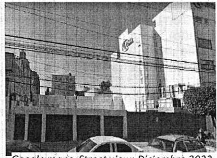
Google maps, Street view: Diciembre 2022

En conclusión, de la información descrita en los párrafos anteriores, se desprende que en el predio objeto de investigación se realizaron trabajos de demolición de una edificación de tres niveles de altura y la habilitación de una estructura metálica para obra nueva en el predio objeto de investigación, dichos trabajos no contaron con Registro de Manifestación de Construcción y/o Licencia de Construcción Especial ; por lo que corresponde a la Dirección General de Gobierno y Asuntos Jurídicos de la Alcaldía Venustiano Carranza, concluir el procedimiento de verificación administrativa en materia de construcción para el predio en comento e imponer las medidas de seguridad y sanciones que a derecho correspondan, así como enviar copia de la resolución emitida al efecto a esta Entidad. -----