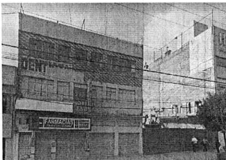
Google maps, Street view: Diciembre 2016

A efecto de mejor proveer, personal actuante realizó la consulta a la base cartográfica de Google maps, y en uso de la herramienta Street view, se realizó un estudio multitemporal comparando las imágenes obtenidas en dicha base y las de los reconocimientos de hechos, así mismo se levantó el acta circunstanciada correspondiente, se hizo constar que en el predio denunciado, se desplantaba una edificación de 3 niveles de altura con diversos locales en planta baja, misma que fue demolida entre el año 2016 y al mes de diciembre de 2022, como se muestra en las siguientes imágenes: -----