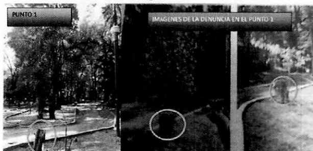
Imagen fotográfica muestra la vista actual del jardín escrito en la denuncia.