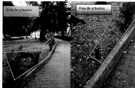
Imagen fotográfica muestra la vista actual del jardín escrito en la denuncia.