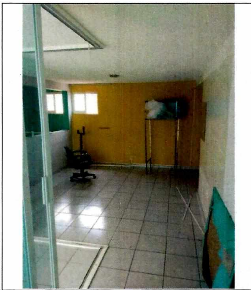
Interior del departamento denunciado.

Finalmente, mediante correo electrónico la persona denunciante manifestó que los responsables del domicilio denunciado habían desocupado el departamento, por lo que ya no se presentaba la problemática de su denuncia.